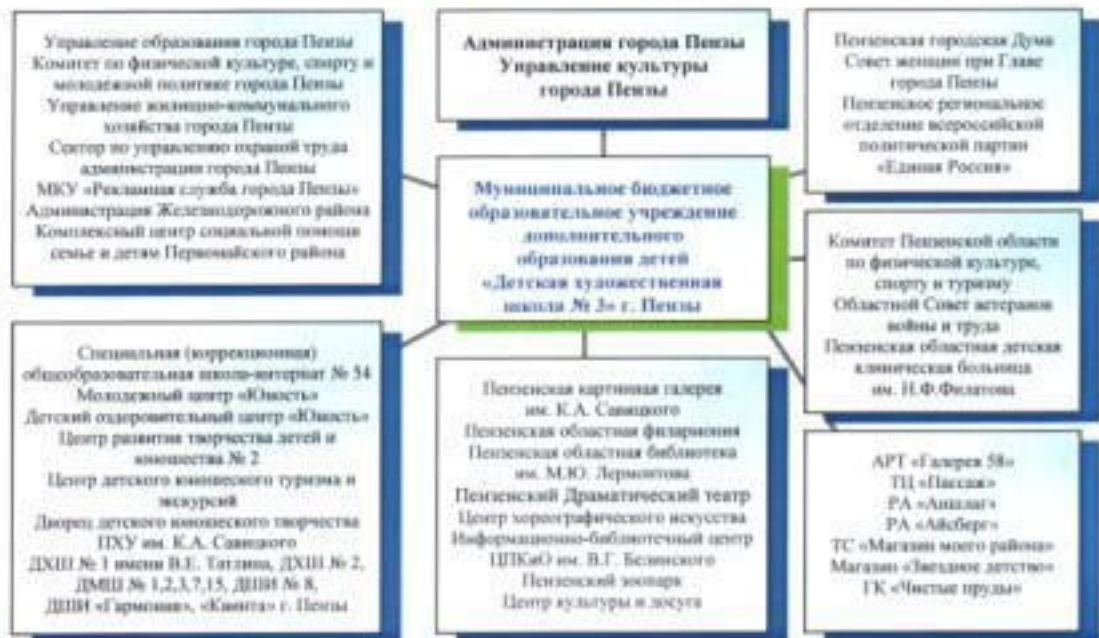
Схема взаимодействия в социуме МБОУ ДОД «ДХШ № 3» г. Пензы